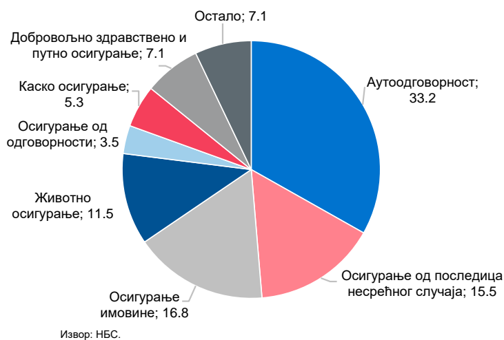
Графикон – Број приговора по основима (друштва за осигурање) (у %)

Највећи број приговора на поступање друштава за осигурање у посматраном периоду односио се на аутоодговорност – 33,2% и осигурање имовине – 16,8%.