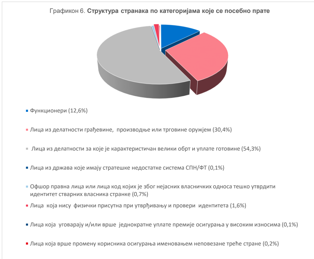
Графикон 6. Структура странака по категоријама које се посебно прате