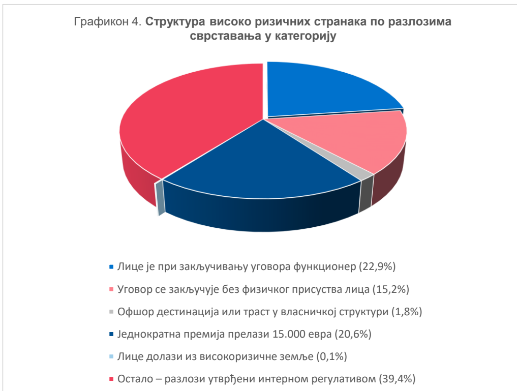
Графикон 4. Структура високо ризичних странака по разлозима сврставања у категорију

Сврставање странке у висок ризик условљено је одређеним њеним карактеристикама као разлозима таквог сврставања, чија је структура дата у наредном приказу.