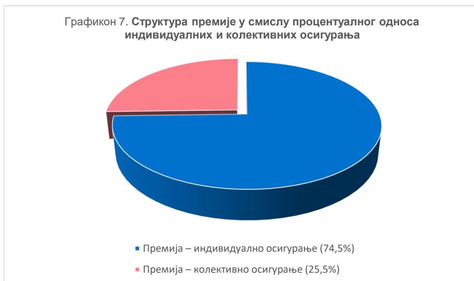
Графикон 7. Структура премије у смислу процентуалног односа индивидуалних и колективних осигурања

Друштва за осигурање су по основу уговора о животним осигурањима током 2023. године имала следећу структуру премије, према природи уговора.