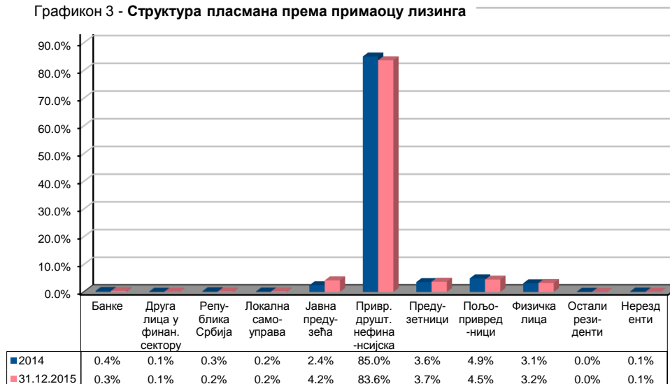
Графикон 3 - Структура пласмана према примаоцу лизинга

Учешће осталих прималаца лизинга је знатно ниже. Пољопривредници су у укупним пласманима учествовали са 4,5%, јавна предузећа са 4,2%, предузетници са 3,7%, и физичка лица са 3,2% .