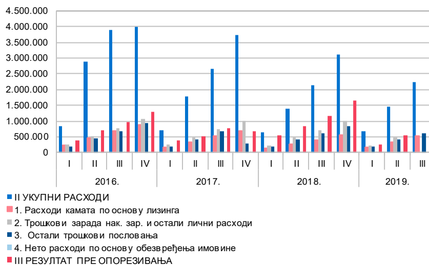
Графикон 2. Структура расхода

Структура најзначајнијих расхода приказана је у Графикону 2 – Структура расхода .